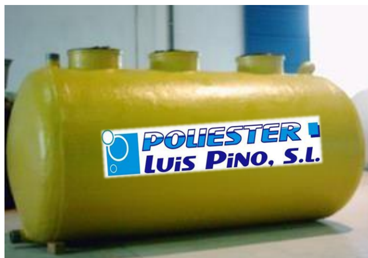
IMAGEN NO CONTRACTUAL