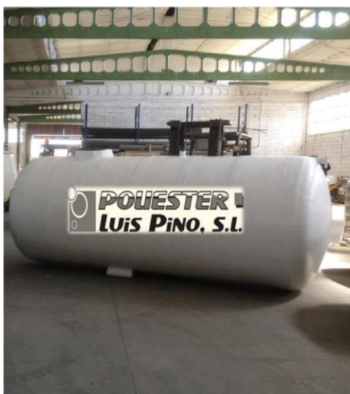
IMAGEN NO CONTRACTUAL